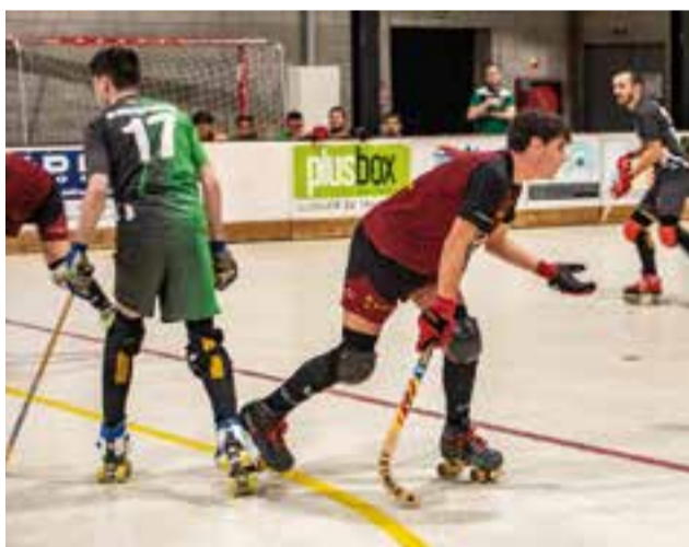
L'HC Castellar perd una oportunitat d'or. || A. SAN ANDRÉS

Els blanc-i-vermells segueixen a la 14a posició, en llocs de promoció de descens, abans de rebre un CF Les Franqueses en ratxa, que fa sis jornades se perdre amb cinc victòries i un empat. ➔ || A. SAN ANDRÉS