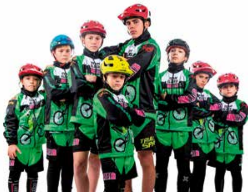
Els integrants de l'equip 'ELBIXU-ADN Trial' per a la temporada 2019.

Partits a fora 11:00 CH Ripollet - iniciació B