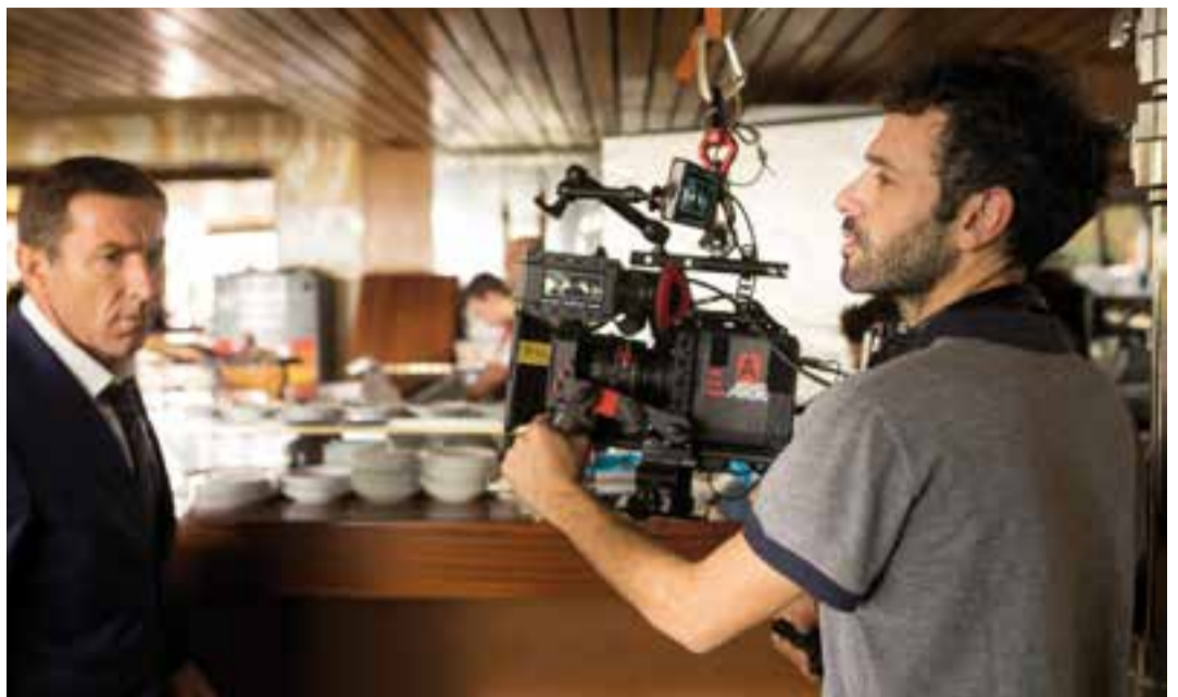
A l'esquerra, Antonio de la Torre, actor protagonista de 'El Reino'. A la dreta, el director, Rodrigo Sorogoyen.

La pel·lícula Carmen y Lola també es projecta diumenge 10, a les 21 hores.