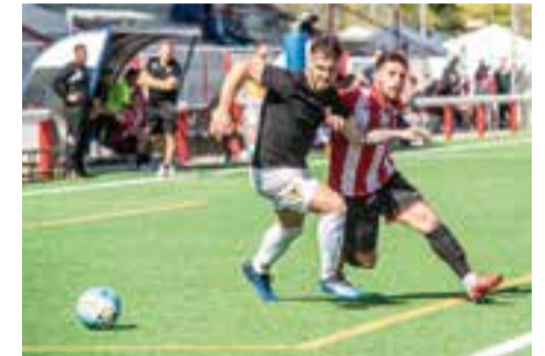
Empat del Castellar a Parets.