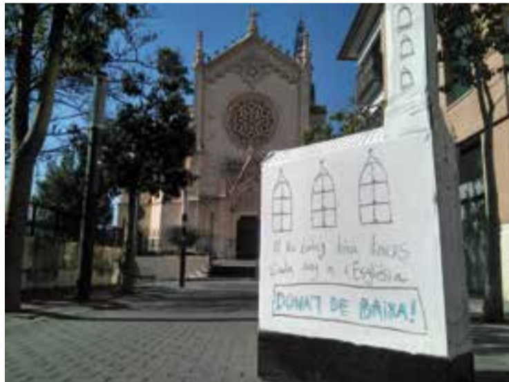
El reclam de la campanya de l'Assemblea Llibertària.

Des de l'Assemblea Llibertària es facilita el formulari necessari per apostatar; al qual s'ha d'adjuntar una fotocòpia compulsada del DNI. Els dos documents s'han d'enviar, preferiblement per correu certificat, a l'arquebisbat o diòcesi a què pertany la parròquia on es va fer el baptisme. L'últim pas és rebre una carta de l'església que demana les dades personals i les dades del baptisme de la persona que vol apostatar. En tot cas, aquestes dades han d'estar signades per un notari eclesial, qual-sevol mossèn, de fet. †