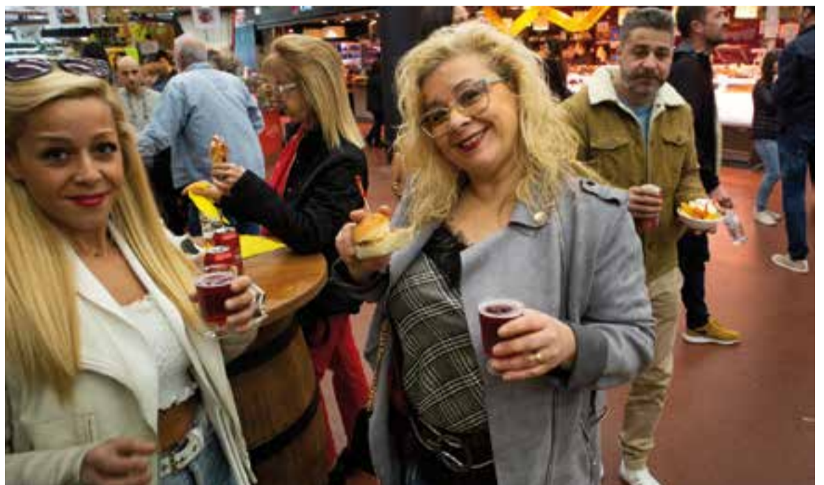
Sis parades diferents del Mercat van oferir tapes variades, a més de begudes, diumenge passat.