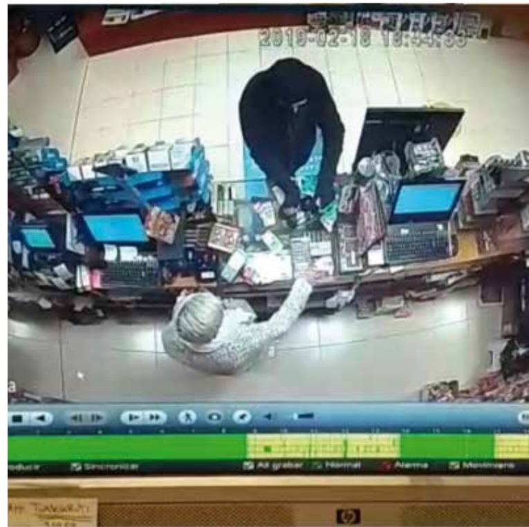
Imatge de la càmera de seguretat on es va produir un dels robatoris.