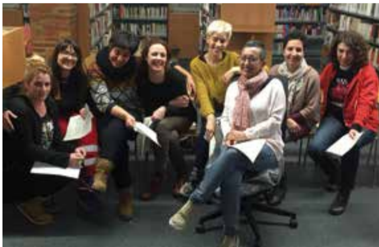
Vuit actrius de l'ETC llegiran les biografies de dones oblidades de la història. || CEDIDA

Dissabte, de 9 a 15 hores, els comerços del carrer Major es disfressen de 'La Granja'. A les 17 hores, al carrer Portugal es farà la concentració de carrosses, comparses i xarangues i s'iniciarà la rua de Carnaval. Enguany, hi ha hagut 12 inscripcions. A les 19.30 hores la rua finalitzarà a la plaça de la Fàbrica Nova, amb el lliurament de premis i la música del DJ Toni Les. Un any més, Colònies i Esplai organitza la Truitada popular, que enguany arriba a la 33a edició. + || M. A