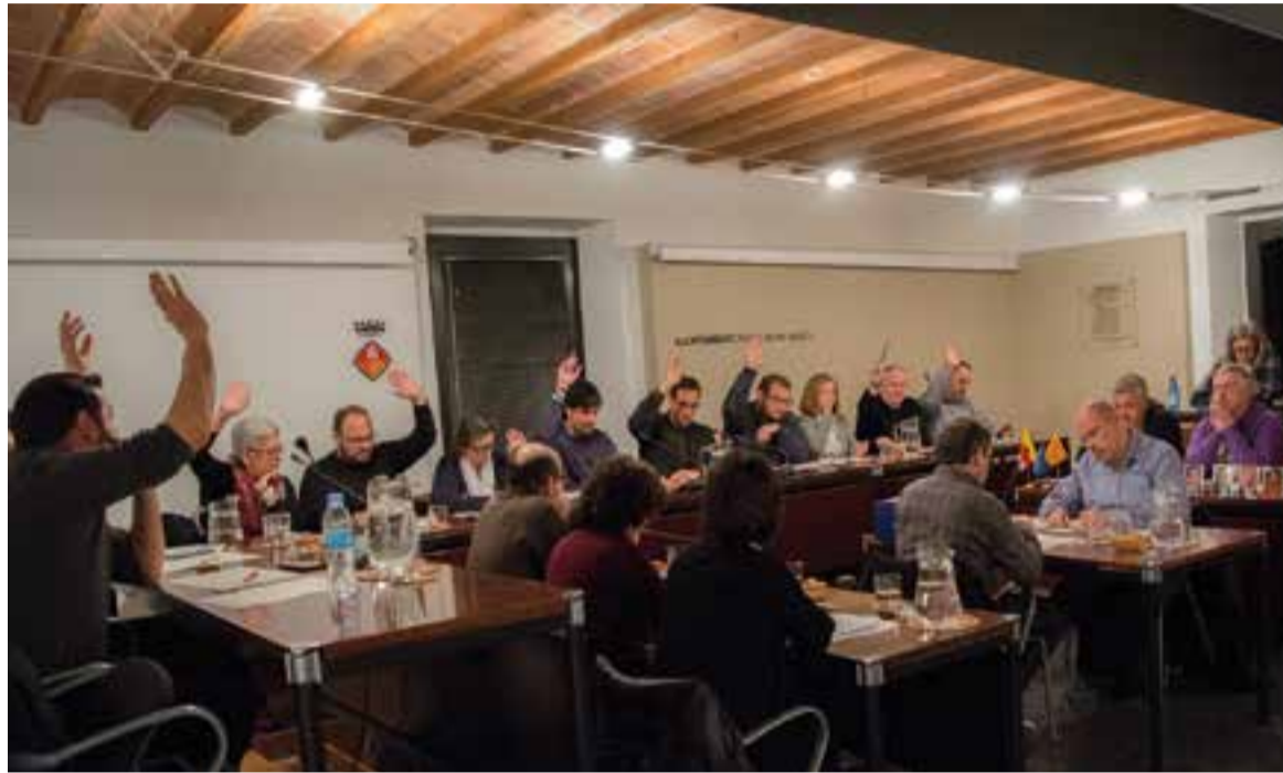
Una de les votacions del ple de dimarts.