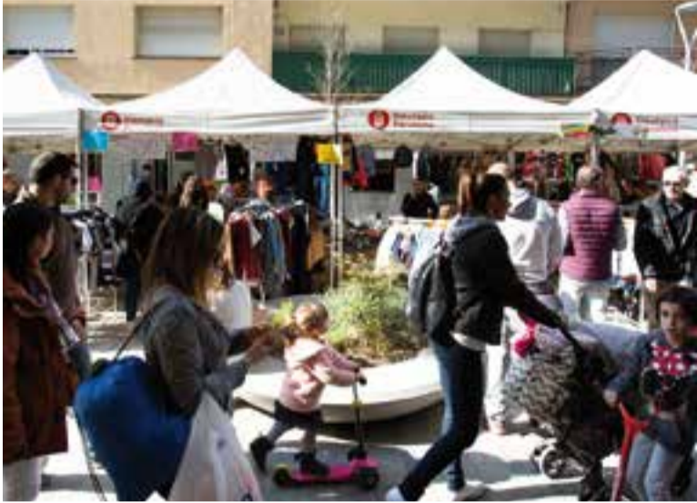
Els carrers de l'Illa del Centre van estar plens de gent.