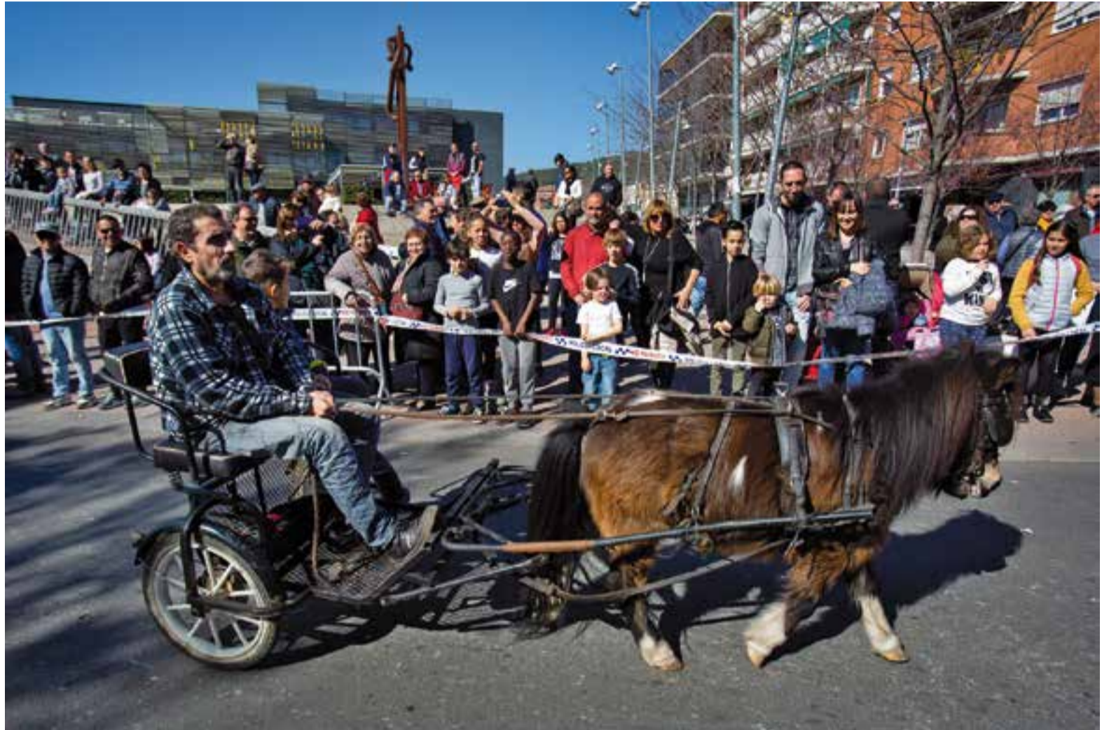
La passada va fer tres toms al Passeig, davant de centenars de persones, en un matí radiant.