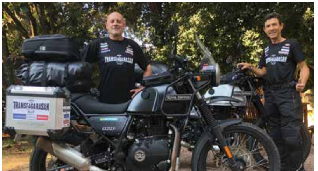
A dalt, a Transfagarasan, als Carpats de Romania. A baix, Humet i Cots amb les Himalayan.