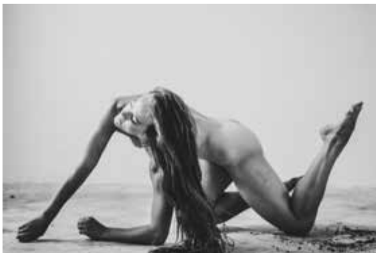
'Bobbi Jene', el DocBarcelona del Mes de març.

Barbé i diversos testimonis de la pel·lícula. Dijous 14, a les 20.30 hores, es projectarà El silencio de otros , una pel·lícula espanyola dirigida per Almudena Carracedo i Robert Bahar. Ha rebut premi Goya 2018 a millor documental i premi del públic a millor documental (secció Panorama) al Festival de Berlín 2018. També ha estat nominada als Premis del Cinema Europeu i als Premis Forqué. De divendres a diumenge seguiran les projeccions amb Entre dos aguas , Cold War , The Miseducation of Cameron Post i Un día más con vida , entre d'altres. ➔