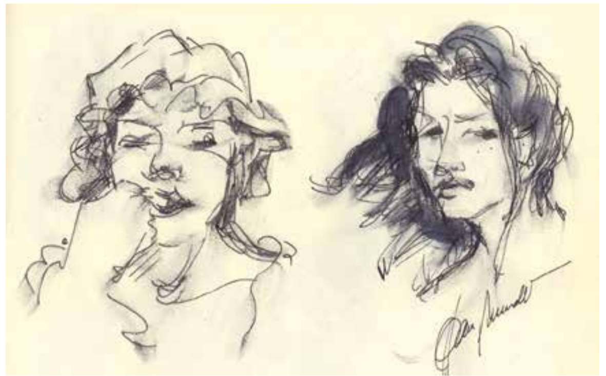
© Jugant amb artpen i el dit esquerre. || JOAN MUNDET

De la mateixa manera que, si no sabeu cantar, però sí que sou capaços d'alliberar-vos taral·leiant amb estil propi qualsevol ritme, cançó o melodia, també podeu tantejar gràficament les imatges que tingueu al davant o que s'originin en la vostra imaginació. Tant se val que el resultat agradi o no als altres, es tracta de la vostra llibertat expressiva sense involucrar ni molestar ningú en aquest cas, i a més