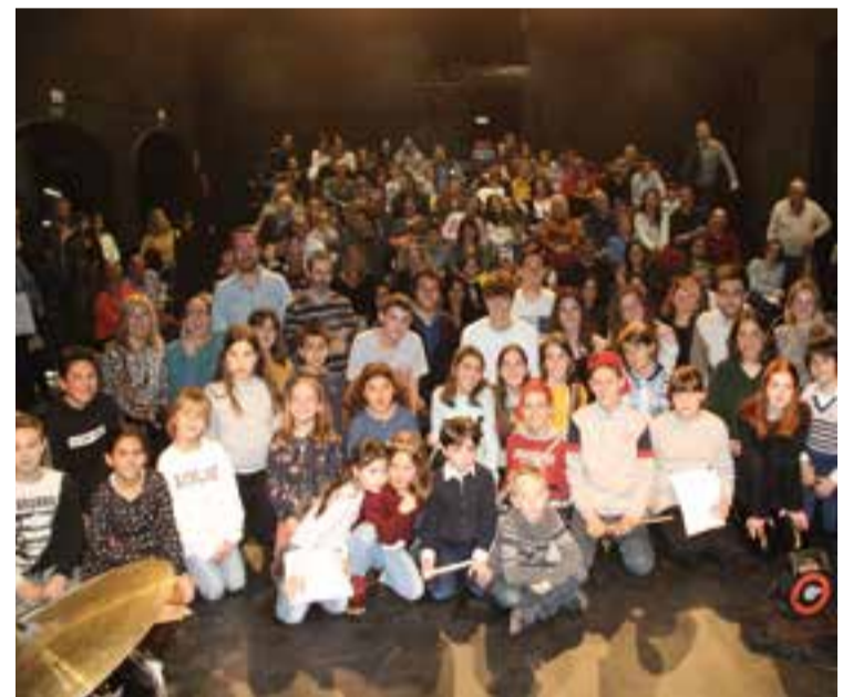
Alumnes d'Espaiart i familiars, el dia de les "audicions d'hivern".

Els alumnes de l'escola, convertits en músics a dalt de l'escenari, van emocionar amb les seves interpretacions els familiars i amics que omplien la sala. Els estudiants acaronaven els instruments mentre feien sonar les partitures i van crear un espai, en molts moments, molt divertit. ➔