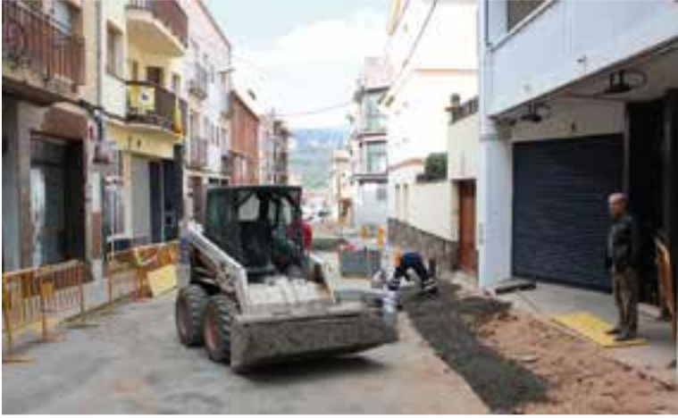
Actuació a les voreres del carrer Doctor Rovira. || AJUNTAMENT