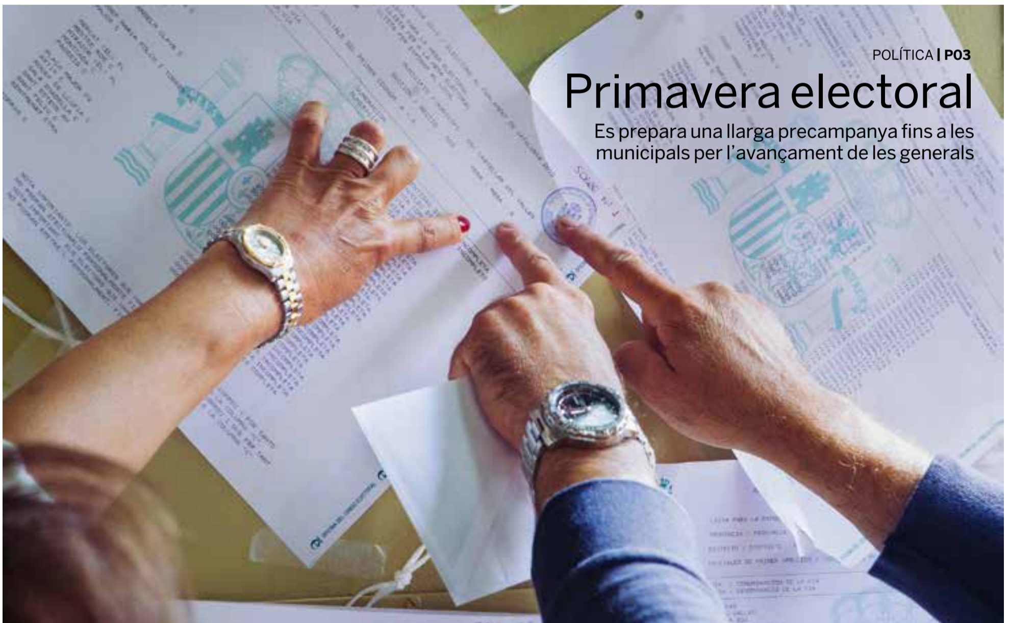
Els castellarencs van votar per darrera vegada el 21 de desembre en unes eleccions al Parlament de Catalunya marcades per l'aplicació de l'article 155.

Es prepara una llarga precampanya fins a les municipals per l'avançament de les generals