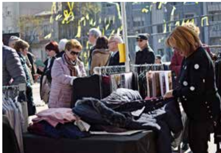
Imatge d'una de les parades de la fira de l'any passat.

Per crear una bona ambientació a la fira, els discjòqueis Dj Re & Dj Fer amenitzaran la fira. La botiga de roba Herois realitzarà un taller de pintar cares per a tots els nens i nenes que s'adrecin a la seva carpa. + || REDACCIÓ