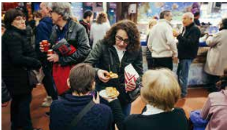
Els clients van omplir el Mercat durant la Passada de tapes del 2018.

Els paradistes del Mercat aprofiten la passada dels Tres Tombs per oferir tapes delicioses