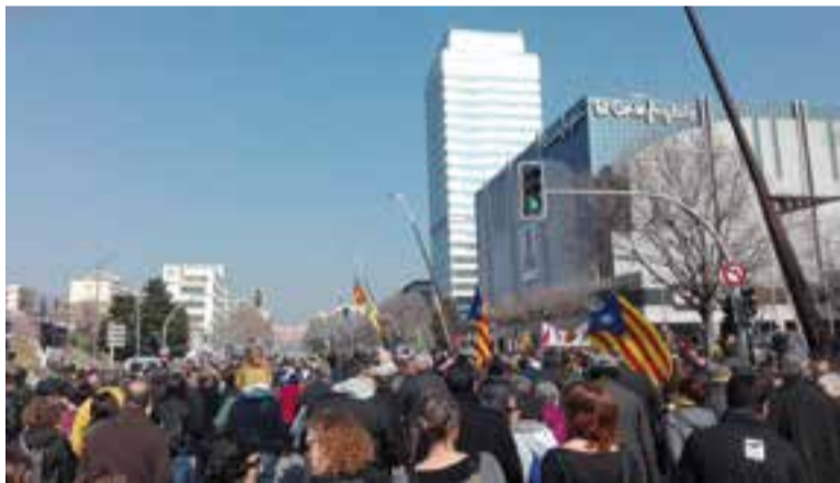
Alguns castellarencs van participar a la manifestació de Sabadell al migdia.

El CDR de Castellar i diversos vilatans a títol particular van decidir participar en la manifestació que es va convocar al migdia a Sabadell i que sortia dels Jutjats, a l'Eix Macià. Des de l'ANC de la vila també es va instar la ciutadania a assistir a la manifestació de la tarda a Barcelona així com a la ja habitual concentració dels dijous a la plaça d'El Mirador a les 19.30 hores. +|| REDACCIÓ