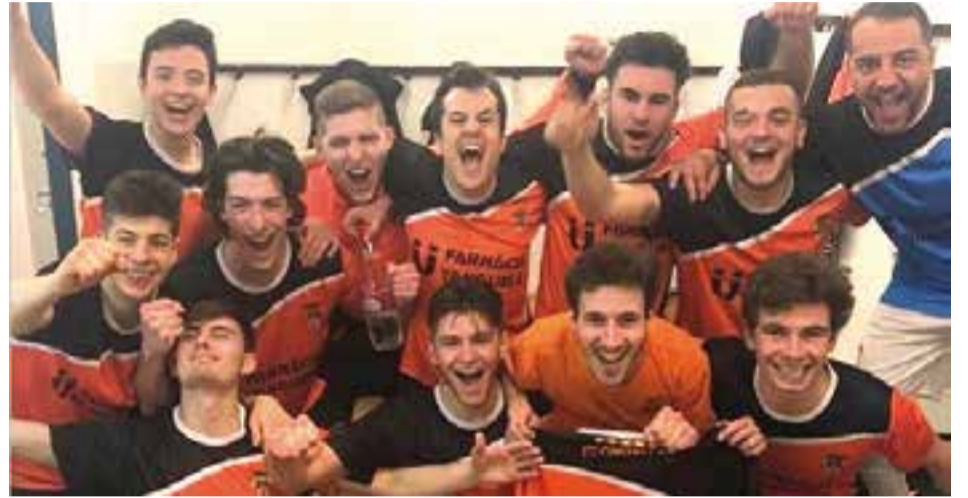
Els jugadors de l'FS Castellar després d'aconseguir la victòria a Gavà.