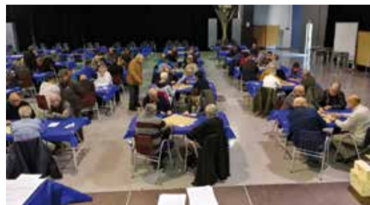
Van participar-hi 42 parelles d'arreu de Catalunya