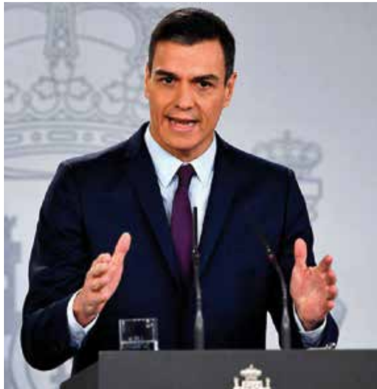
Pedro Sánchez en la compareixença en què va anunciar la data electoral.

1. "És difícil d'entendre. El govern de Sánchez ha cedit a les pressions de la ultradreta i va trencar tot el diàleg amb Catalunya. Xuta la pilota endavant ara que sembla que les enquestes li poden anar a favor i consolidar la seva figura. Però quan no es té capacitat de diàleg, no es poden resoldre els problemes de la majoria".