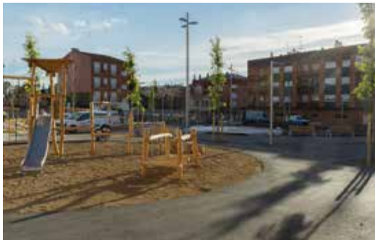
El nou aspecte de la plaça Llibertat, que acull una festa dissabte.