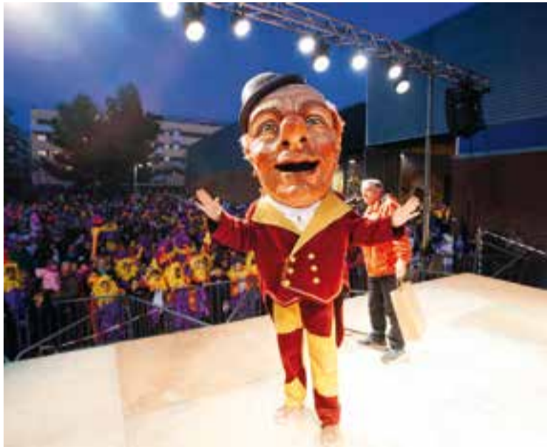
El Toites Papallongues, rei Carnestoles, l'any 2017, a l'arribada de la Rua.

Les candidatures es poden presentar fins al 27 de febrer