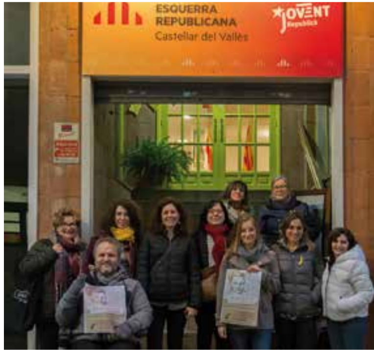
Membres de l'Assemblea de Dones d'ERC, durant la presentació de la mostra.

Per tal de recopilar el material per a l'exposició, la secció local d'ERC fa una crida a la ciutadania perquè envïin les imatges i els textos explicatius sobre les dones que volen homenatjar al correu ladonadelamevavida@hotmail.com. Malgrat que a hores d'ara comptem amb alguns testimonis com a punt de partida per a la mostra, l'Assemblea de Dones d'ERC posa l'accent en què l'exposició és oberta a tota la ciutadania, tant a entitats com a vilatans a títol personal. Les fotografies i la informació relacionada amb les seves protagonistes es recolliran fins al 8 de març. L'exposició s'inaugurarà el 16 de març a partir de les 11.30 hores