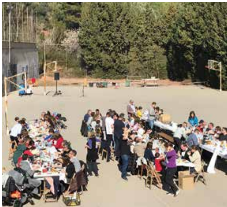
Calçotada solidària d'El Casal, diumenge passat.

A les 18 hores està prevista una sessió de contes solidaris a l'Auditori Municipal a càrrec de Rosa Fité. El donatiu solidari és de 3 euros. +