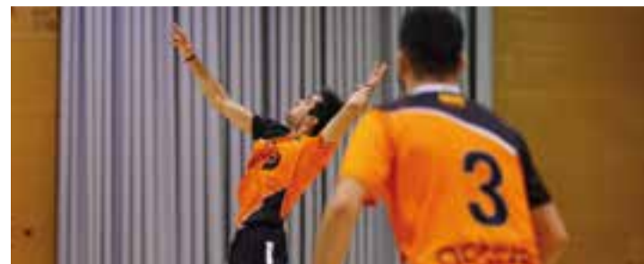
Un partit de vòlei del sènior masculí al Puigverd. || A.S.A.