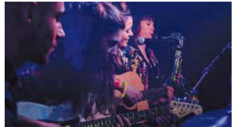
Las Ninyas Te Bailan durant una de les seves actuacions. || CEDIDA

El nom del grup, Las Ninyas Te Bailan, ha anat evolucionant. “Al principi, érem tres i jo era la ‘ninya’ que cantava”. Ara, se'ls han incorporat més noies, i ja són las ‘ninyas’”. “Posem ‘ninyas’ per remarcar que som d'aquí”. Les seves lletres parlen de feminisme, d'amor i desamor, de justícia de gènere, etc. † || M. ANTÚNEZ