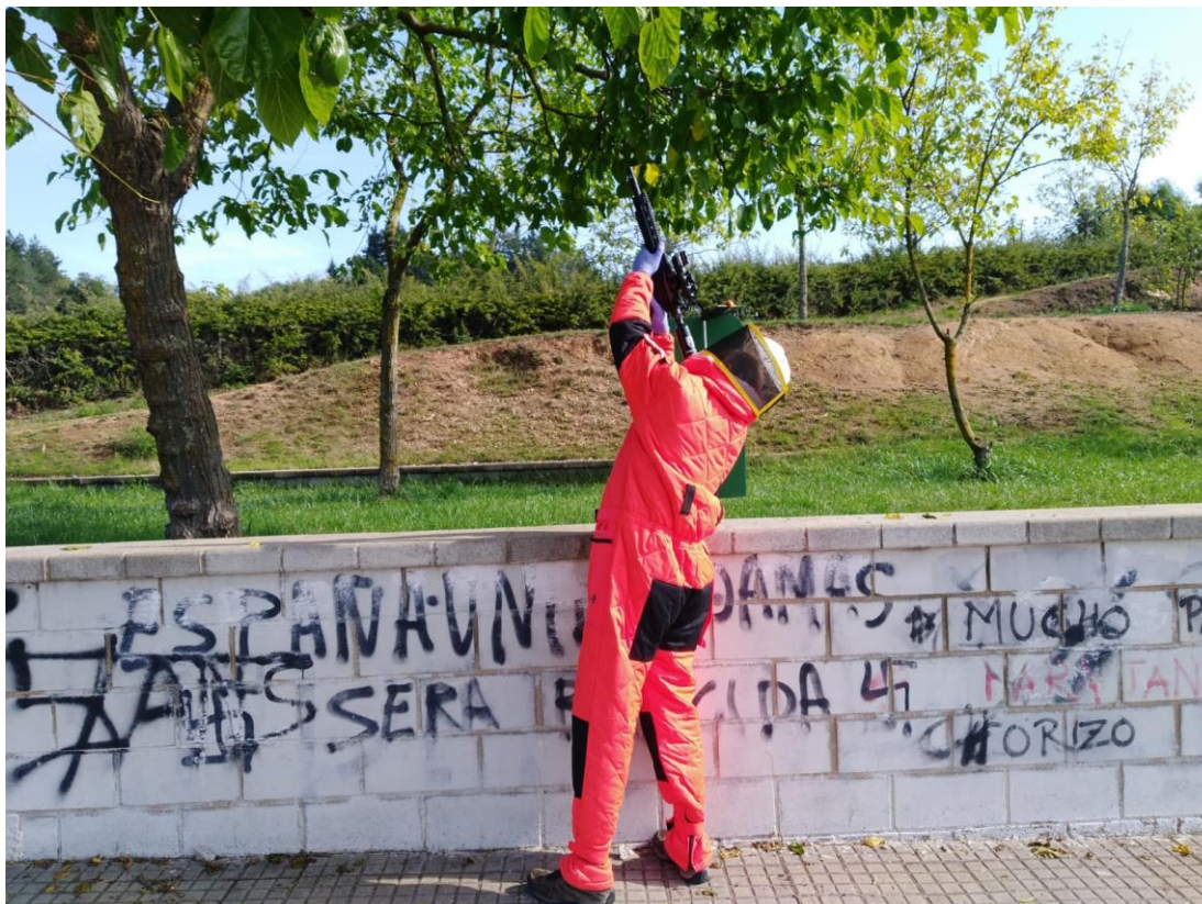
Tècnic d'una empresa de control de plagues inactivant un vesper amb els EPI corresponents