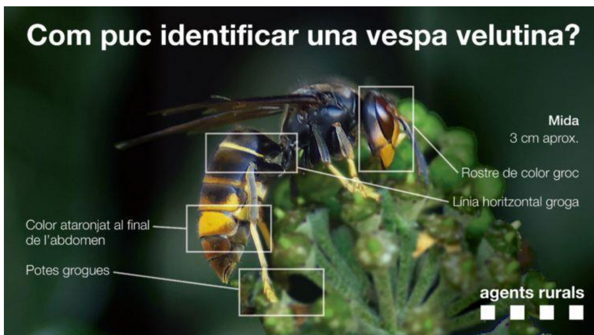
Característiques de la vespa velutina. Cos d'Agents Rurals

La seva mida oscil·la entre 17 i 32 mm de llargària, més gran que Vespula germanica (vespa d'olla autòctona més comuna) i una mica més petita que Vespa crabro . Les obreres i les reines (femelles fecundades) no es poden diferenciar morfològicament. Si bé a la primavera les obreres solen ser clarament més petites que les reines, a la tardor només el major pes i amplada del tòrax de les noves reines permet diferenciar-les de les obreres.