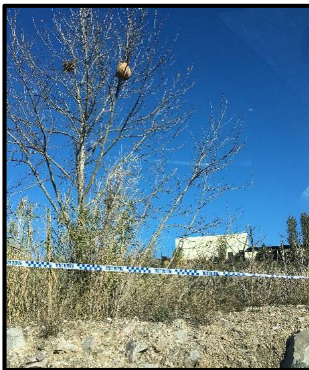
Vesper delimitat amb balisa a l'espera de l'actuació.

La persona que detecti un vesper ha de mantenir-se a una distància mínima de 5 metres i no acostar-s'hi sense l'equip de protecció adequat.