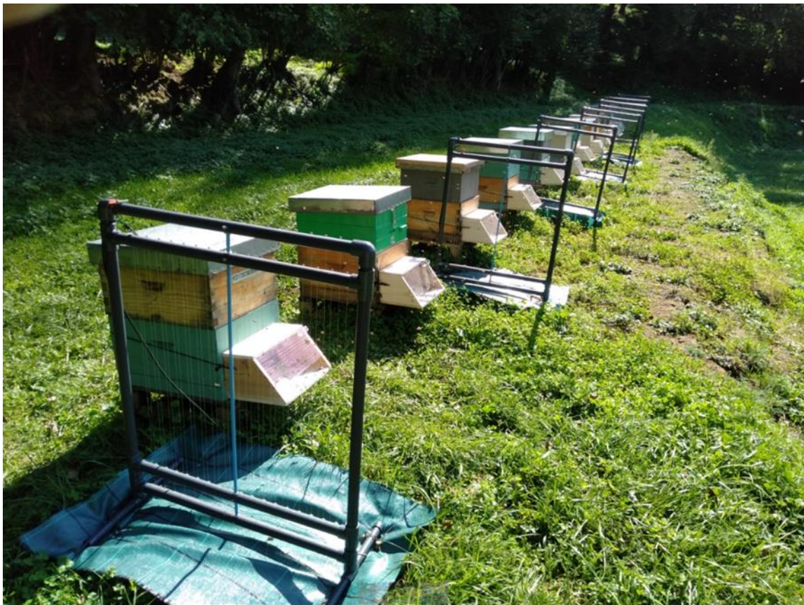
Abellar amb arpes elèctriques i morrioneres.

descàrrega i resten capturades en contenidors. Les morrioneres (del francès musélières) són senzills dispositius inserits al trespador amb una reixa d'uns 6 mm que permet l'entrada i sortida de les abelles de la mel però que no permet l'entrada de les vespes (o la sortida, segons el model). Alhora, en disposar les abelles d'una major superfície de la rampa de sortida i entrada sense pressió de vespes, en disminueix l'estrès i afavoreix recuperar l'activitat recol·lectora.