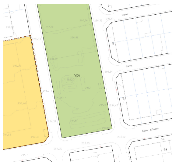
Plànol ordenació-e5. Text Refós POUM 2016

Cal modificar doncs el plànol de qualificació c2 i el plànol d'ordenació e4.