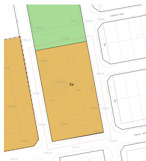
Plànol ordenació-e5. Mod. IV POUM